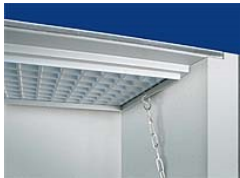
Die optionale Sicherung gegen Ausheben erfolgt von außen unsichtbar.

ELSA ersetzt Ihre alte Lichtschachtabdeckung komplett. Lassen Sie sich von der Ästhetik und Funktion von ELSA begeistern.